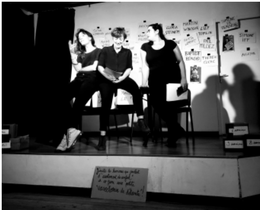
Représentation CECI EST UN CINTRE - Lyon oct 23 FICHE TECHNIQUE

En 2017, est créé un spectacle sur les règles: Du superflu au super flux , commandé par le Planning Familial de Brioude pour la Nuit des femmes. En 2018, une lecture spectacle sur la sexualité des quinquagénaires voit le jour, nouvelle commande de la Nuit des femmes de Brioude. En 2019, est créé un spectacle sur le thème des violences à l’encontre des Femmes en situation d’autisme: Les Claques et les étoiles , sous le marrainage du Planning Familial du Rhône et de Filactions.